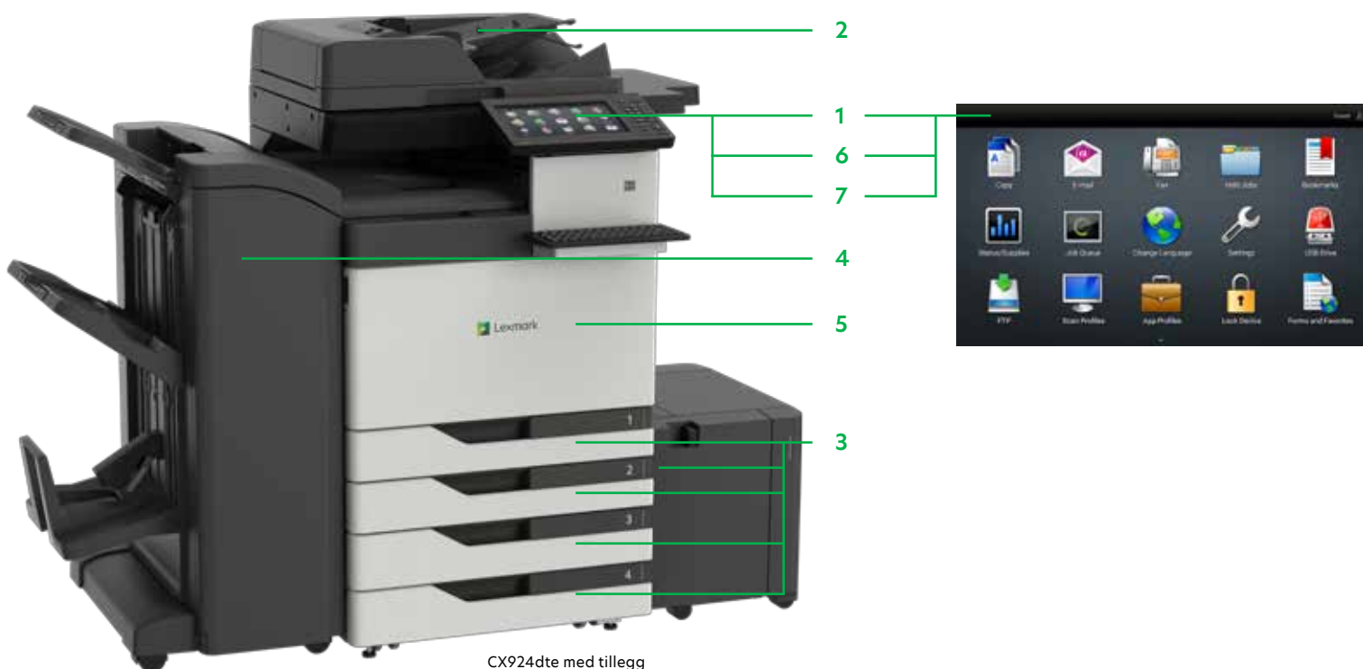
CX924de med tillegg

Skriv ut Microsoft Office-filer, PDF-er og andre dokumenter og bildetyper direkte fra flash-enheter, eller velg og skriv ut dokumenter fra nettverksservere eller stasjoner på nettet.